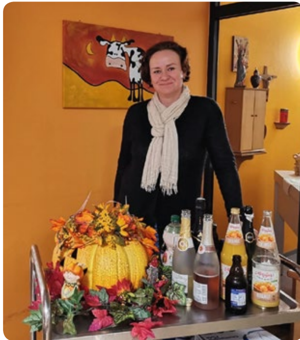
Ein Getränkewagen zu Halloween.